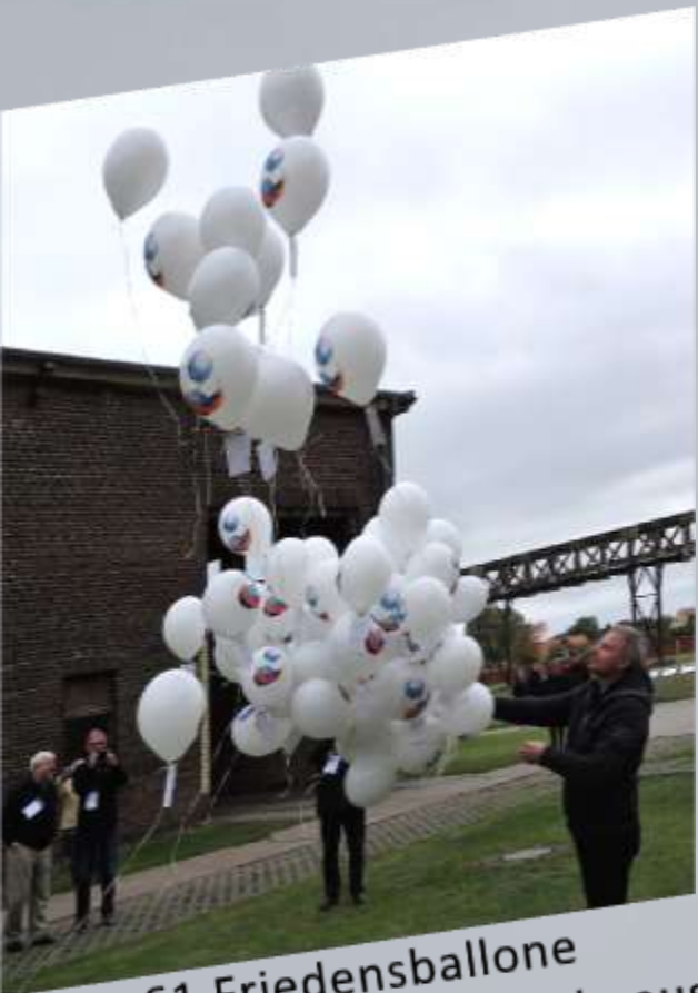
61 Friedensballone starten von Peenemünde aus