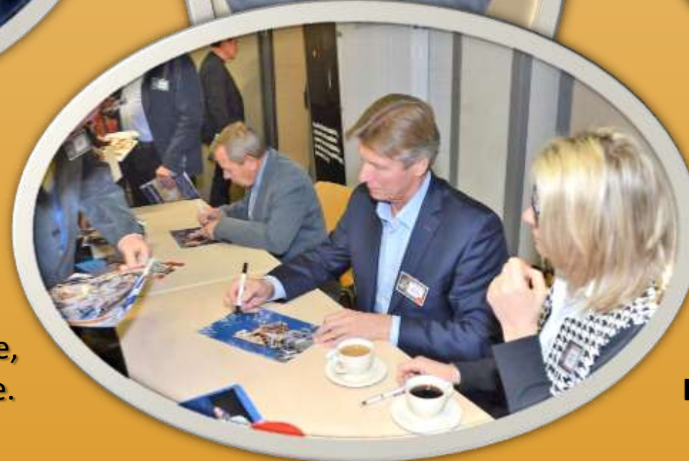
Jedes Jahr wieder: Die Autogrammstunde