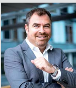
Florian Hahn, MdB (CDU/CSU) Wahlkreis 221: München-Land

https://www.linkedin.com/company/largespace/ https://www.youtube.com/channel/UCTFBpYkv3PtibrN-vEB_LA https://twitter.com/lss_gmbh